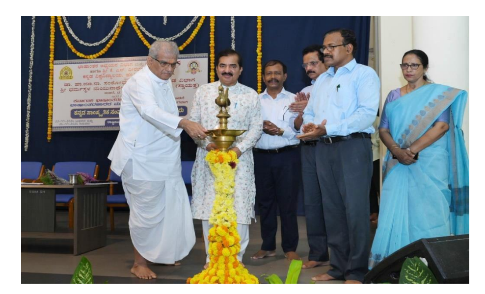
National Seminar on Translation